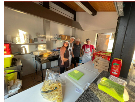
Chiosco della Pro Loco al SOS Music Summer Party al parco giochi