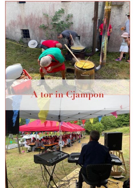
A tor in Cjampon