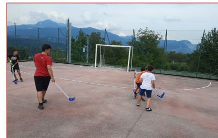
Un paese, tanti sport